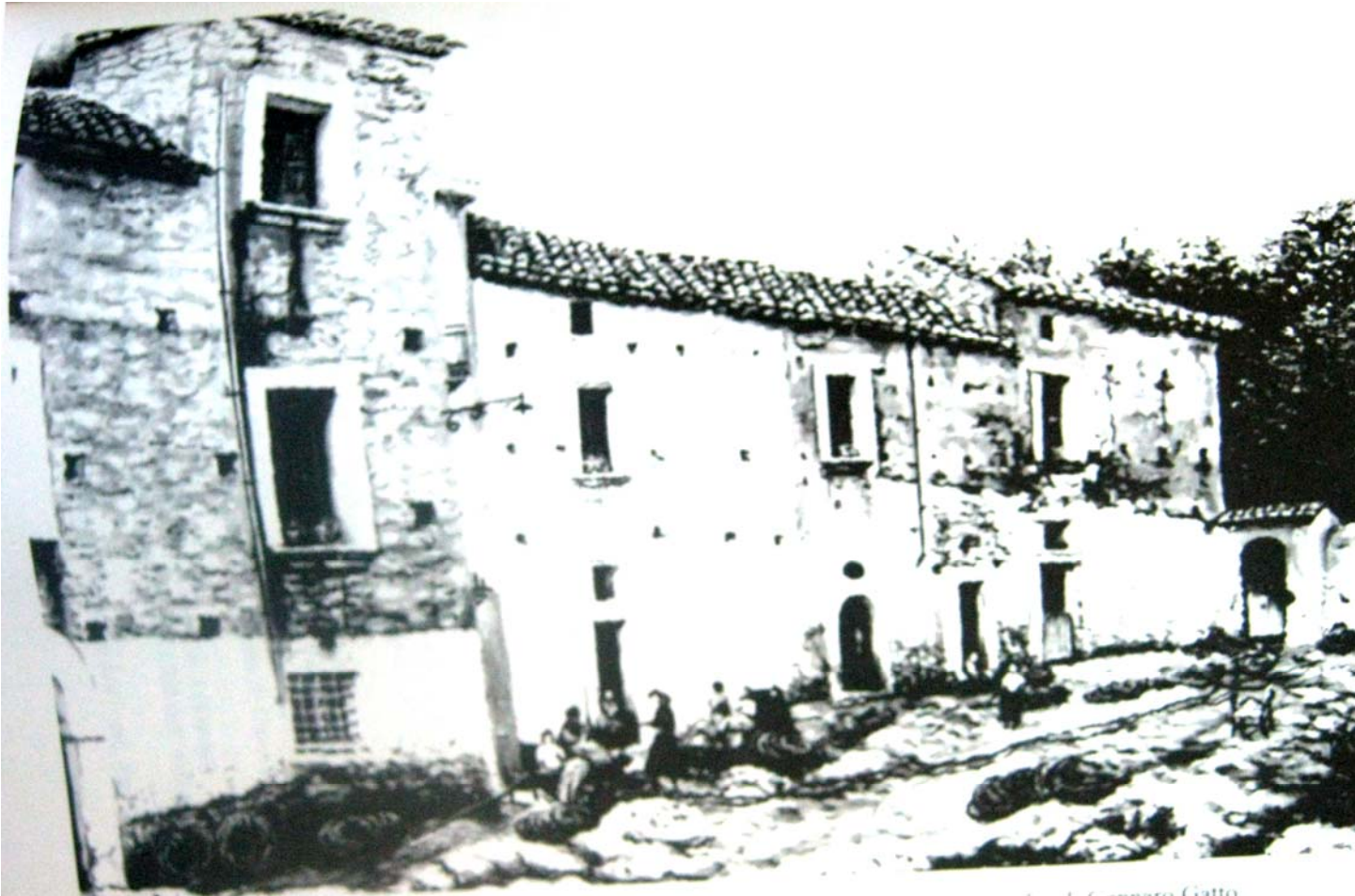
G. Gatto, Lavoranti ai libbàni , 1800